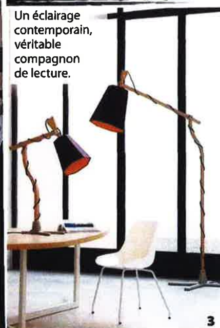
Un éclairage contemporain, véritable compagnon de lecture.