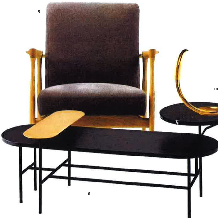
7/ Le plafonnier Luxole mêle la percaline de coton au hêtre massif. Design Kristian Gavoille, 499 €. DesignHeure. 8/ Lampadaire à trois bras en métal laqué noir et laiton. Design Serge Mouille (1952), 5 205 €. Les Eclairagistes. 9/ Fauteuil Floating , 1 280 €. Red Edition. 10/ La lampe de table Serpente dispose d'un bras pivotant, mais surtout elle se pare de métal doré à l'occasion de son 50 e anniversaire. Design Elio Martinelli (1965), 1 438 €. Martinelli Luce. 11/ Table basse Palette en laiton, marbre noir et frêne teinté noir. Design Jaime Hayón, 1 195 €. AndTradition.