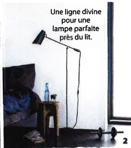
Une ligne divine pour une lampe parfaite près du lit.